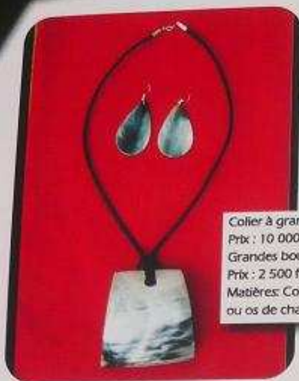
Collier à grand pendentif Prix : 10 000 f cfa Grandes boucles d'oreilles Prix : 2 500 f cfa Matières: Cornes de vaches ou os de chameaux