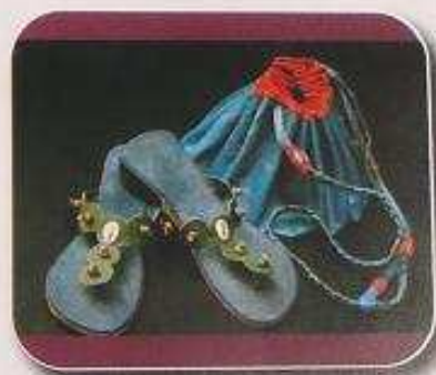
Sac en cuir: Prix: 35 000 f cfa Sandales en cuir: Prix: 13 000 f cfa