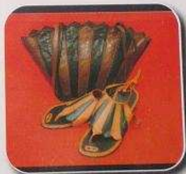
Sac en cuir: Prix: 25 000 f cfa Sandales en cuir: Prix: 13 000 f cfa