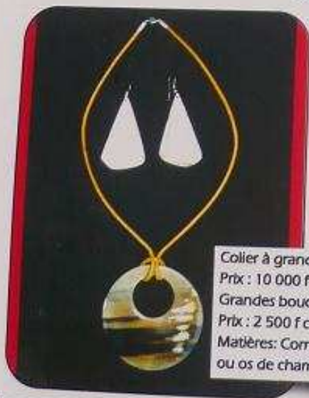
Collier à grand pendentif Prix : 10 000 f cfa Grandes boucles d'oreilles Prix : 2 500 f cfa Matières: Cornes de vaches ou os de chameaux