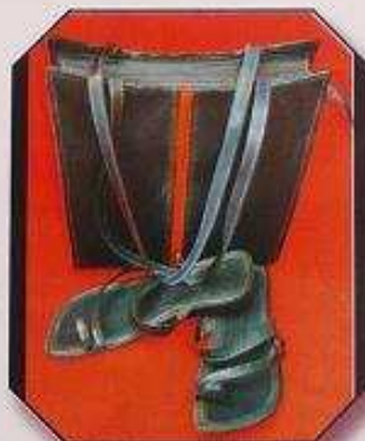
Sac en cuir: Prix: 20 000 f cfa Sandales en cuir: Prix: 13 000 f cfa