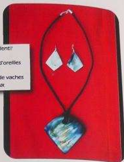
Collier à petit pendentif Prix : 5 000 f cfa Grandes boucles d'oreilles Prix : 2 500 f cfa Matières: Cornes de vaches ou os de chameaux