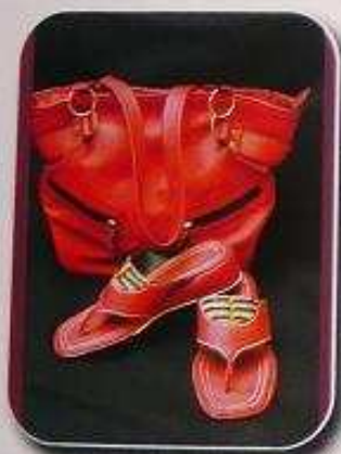
Sac en cuir: Prix: 40 000 f cfa Sandales en cuir: Prix: 13 000 f cfa

Contact : Centre des Métiers du Cuir et d'Art du Niger. Avenue des Sultans. BP 432 Niamey. Tel : (00227) 20 72 23 44. Mail : cmcan_niger@yahoo.fr Site internet : www.cmcan-niger.com