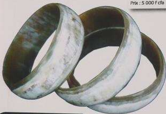
Bracelets larges Matières: Cornes de vaches ou os de chameaux Prix : 5 000 f cfa