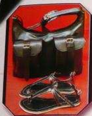
Sac en cuir: Prix: 40 000 f cfa Sandales en cuir: Prix: 13 000 f cfa

Fruit d'un partenariat franco-nigérien, le Centre des Métiers du Cuir et d'Art du Niger a ouvert ses portes en 2004. Il a pour mission de renforcer le potentiel de la filière cuir par l'amélioration des qualifications et compétences de la main d'œuvre. Les principaux domaines de formation sont : tannage/ teinture, maroquinerie/ botterie, gainerie (coffre à bijoux, cadres photo), bijouterie d'accessoires (os, cornes, métal), dépouille d'ovin et bovins, collecte des peaux, commercialisation des produits... Avec plus de 500 produits référencés (chaussures, sandales, sacs de voyage, sacs à main, cartables, bijoux en corne, en os...), le centre est présent à de nombreuses manifestations comme le Salon International de l'Artisanat de Ouagadougou (SIAO); Le Salon Fibres et Matières d'Afrique; Le Salon International de l'Artisanat pour la Femme (SAFEM); Le Festival International de la Mode Africaine (FIMA). Votre magazine a sélectionné pour vous les plus belles créations.